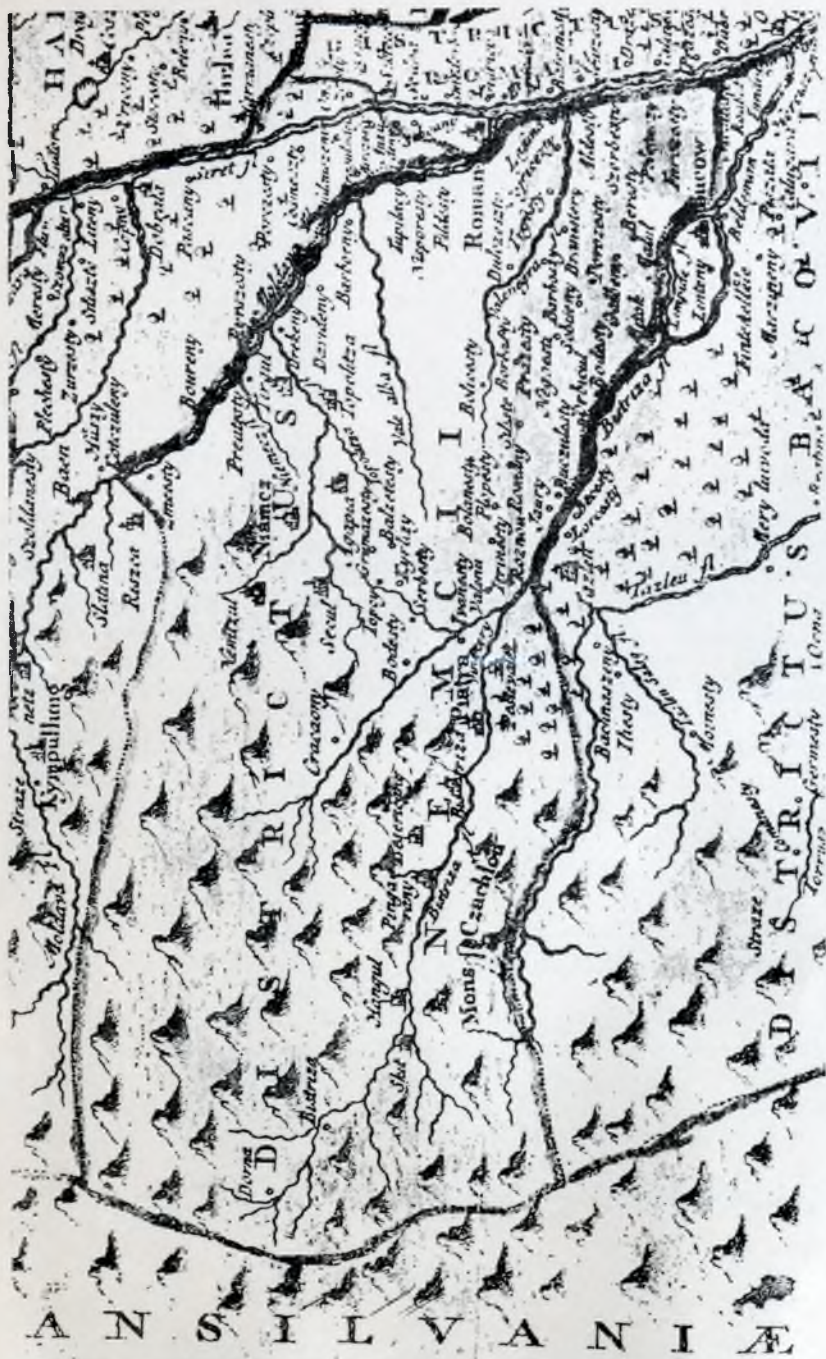
Tinutul Neamț în harta lui D. Cantemir. (Harta Moldovei a lui D. Cantemir — de G. Vâlsan. An. Acad. Române s. III tom. VI. 1926.