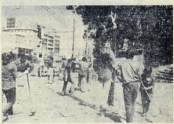
Tineretul chilian solidar cu politica guvernului condus de dr. Salvador Allende, participă cu entuziasm la acțiunile de curățire și înfrumusețare a capitalei. În foto: Tineretul lucrînd la înfrumusețarea orașului Santiago de Chile.

pămînt, pe care acesta s-o lucreze cum dorește. Dar problema rezidă în crearea unui cadru cooperatist, care să-l ajute pe felah să se obișnuiește cu munca colectivă, să beneficieze de mijloace de muncă comune și să sporească randamentul pămîntului”. Scopul cooperativizării agriculturii, a adăugat vorbitorul, este și acela de a crea un climat propice formării unei conștiințe politice în rândurile maselor rurale, subliniînd că acestea vor beneficia de o infrastructură socială, culturală și sanitară corespunzătoare. Președintele Boumediene a subliniat și că scopul privat are de ales între a se asocia sau nu la aceste cooperative. „Nu ne îndoiim, însă a spus el, că aceste cooperative vor reuși să se impună ca un model de economie agrară”.