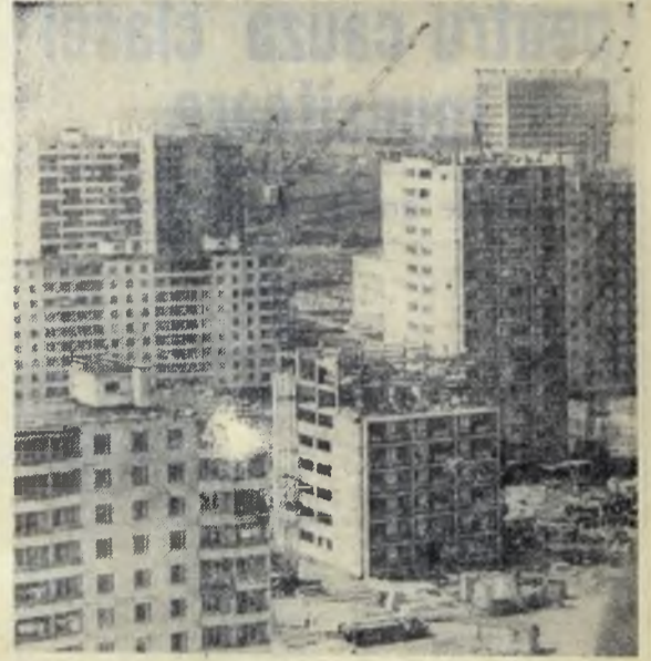
U.R.S.S. — Moscova. În capitală sînt numeroase construcții noi. Sute de mii de familii din Moscova s-au mutat în case noi, orașul continuă să se întindă. În foto: Construirea de noi locuințe în cvartalul Tropeav.

În întreaga Cehoslovacie, memoriei jertfelor de la Lidice li-au fost consacrate numeroase manifestări.